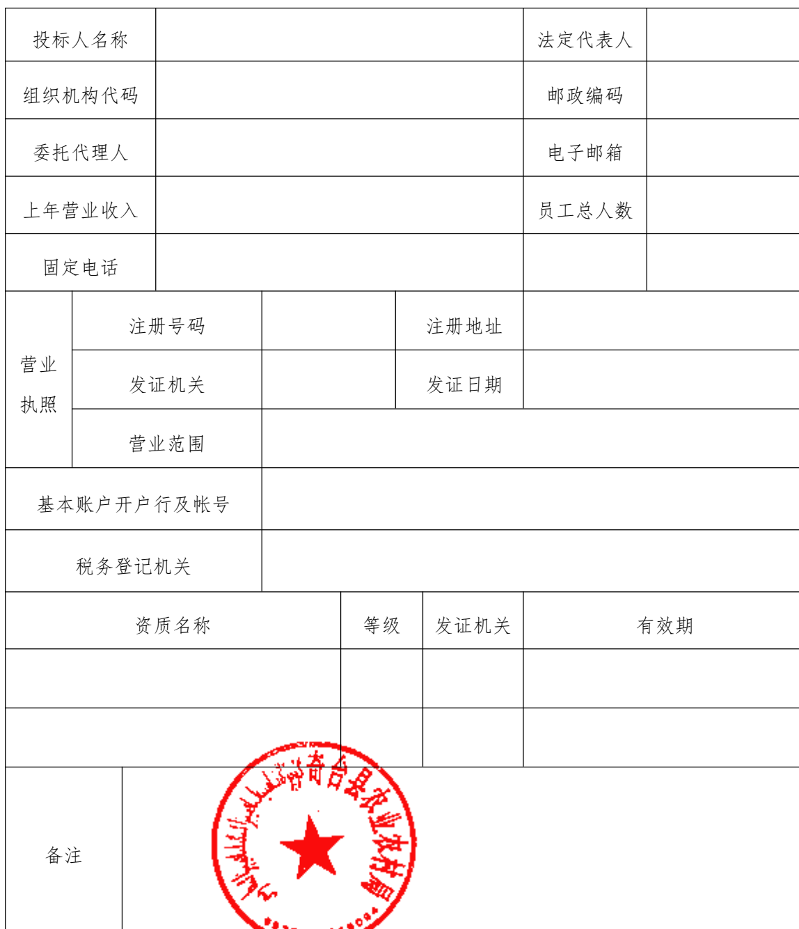
投标人基本情况表