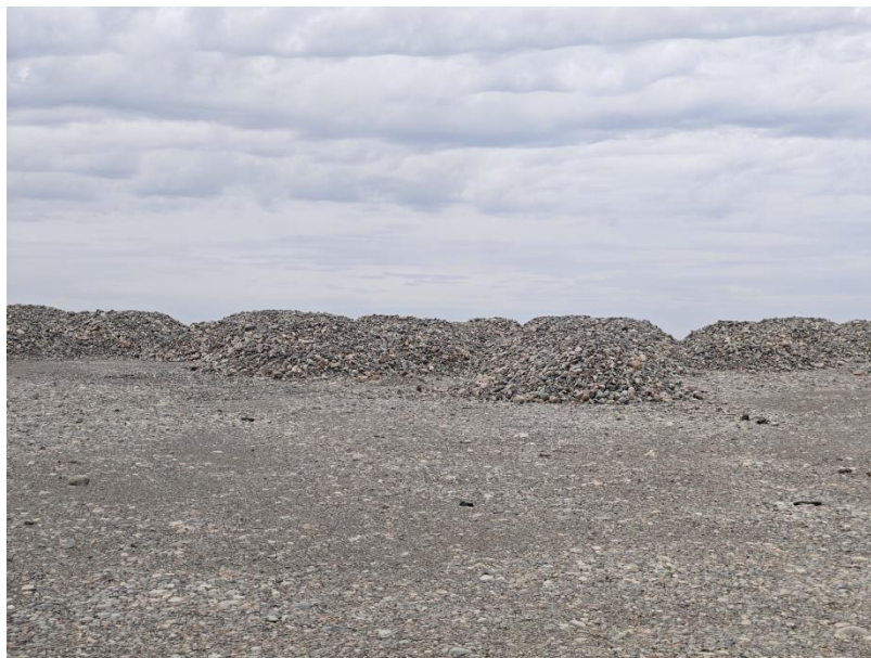
图 1-10 矿区渣堆无序堆放

影响自然环境；开采形成了深大采坑，极大的破坏了自然地貌景观，加剧区内水土流失；开采形成陡坡，存在滑塌的地质灾害隐患，堆砌的废渣形成不稳定斜坡，也存在滑塌的隐患，对周边基础设施造成威胁；现状裸露面，大风刮过时，极易形成风沙，污染空气等问题。