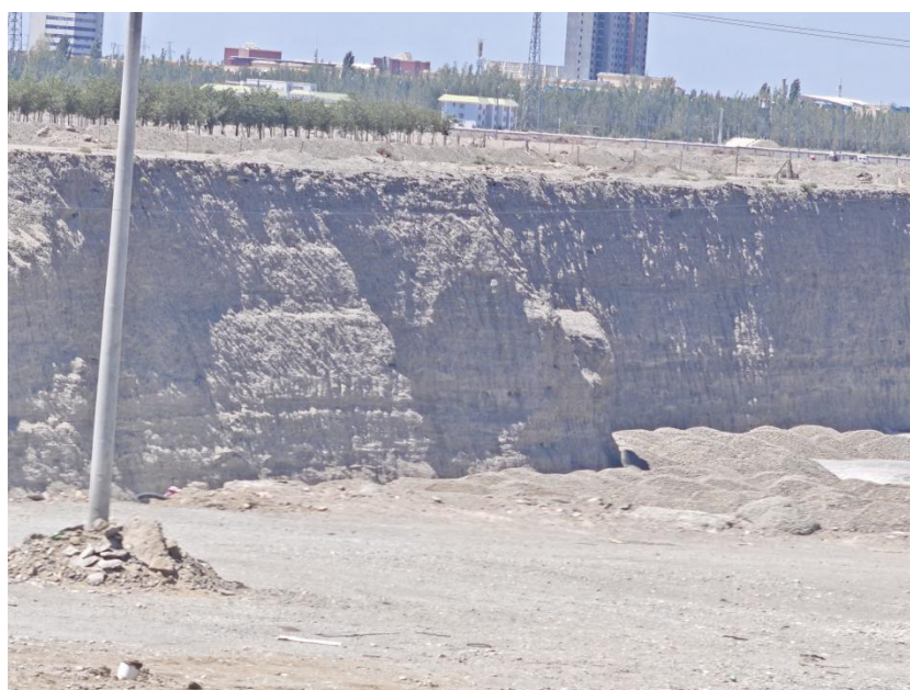
图 1-11 坑壁陡立边坡