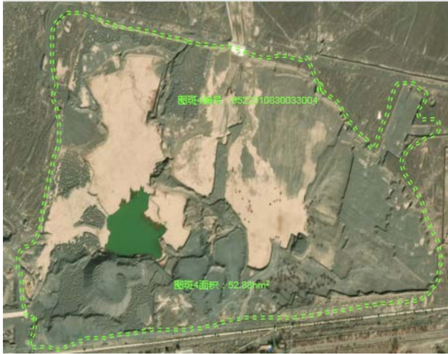
照片1-2-2 图斑4范围（卫星影像）