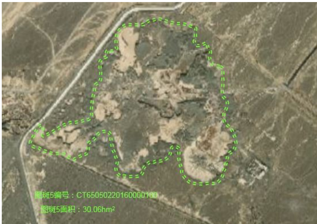
照片1-3-3 图斑5范围（卫星影像）