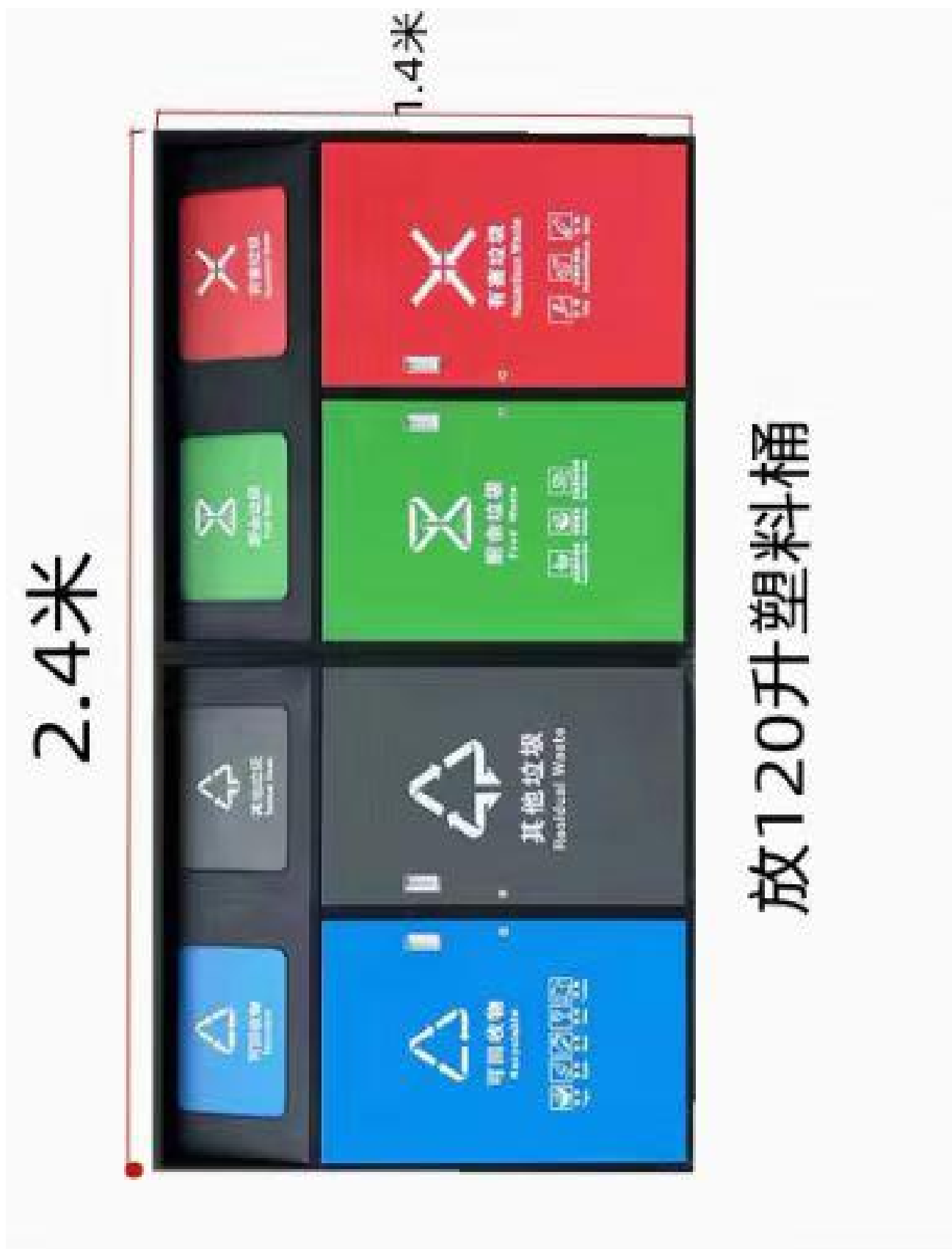
垃圾桶外立面效果图