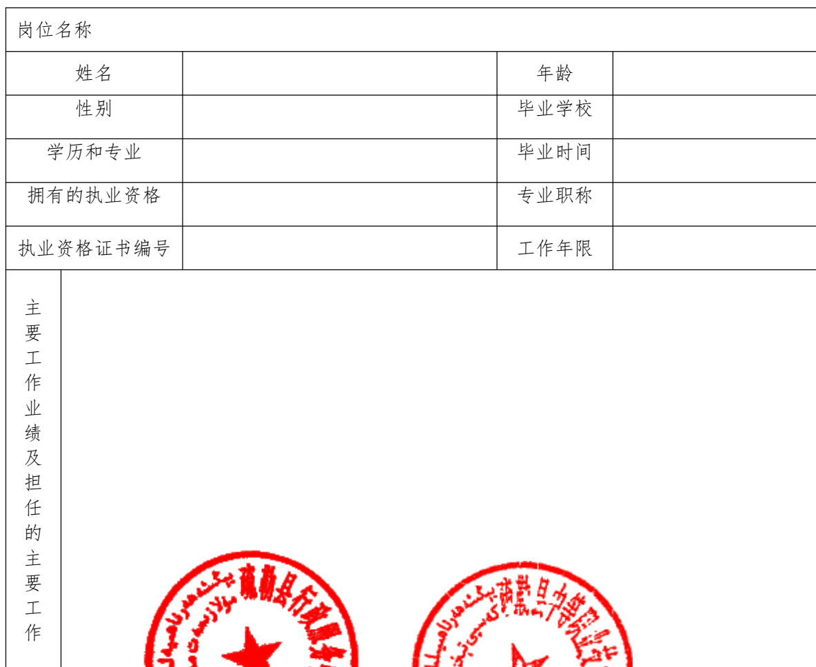
项目组人员简历一览表