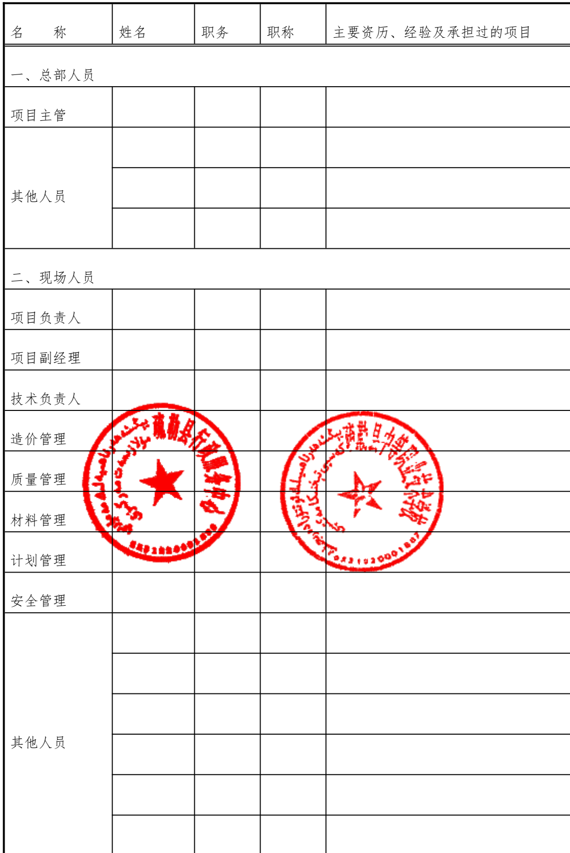
分包人主要施工管理人员表