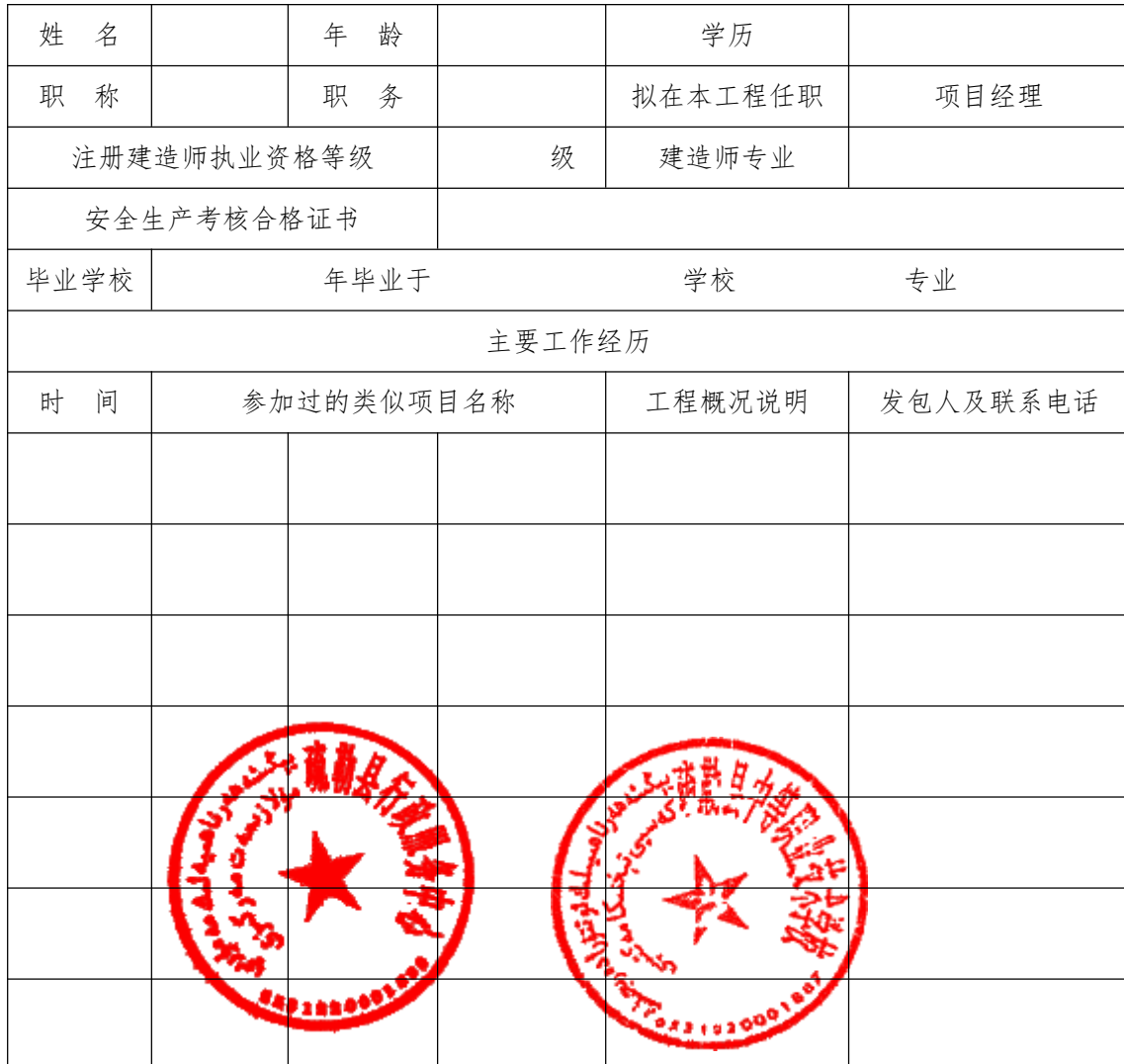
项目负责人情况一览表