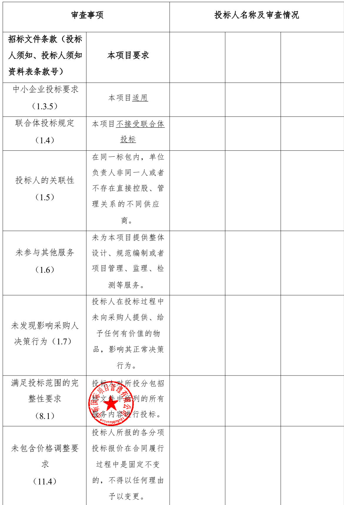
商务符合性审查表