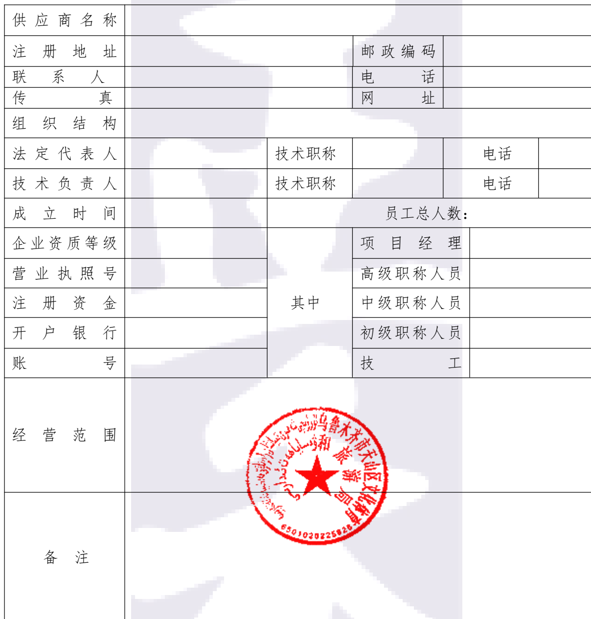
供应商基本情况表