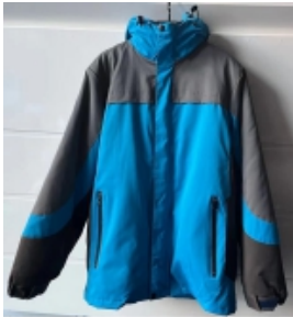
可脱卸式冬装上衣