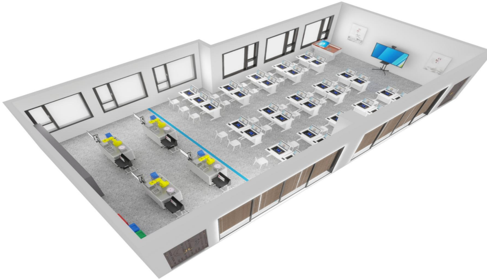
图1 工业机器人虚实融合编程技术实训室预期建成效果图